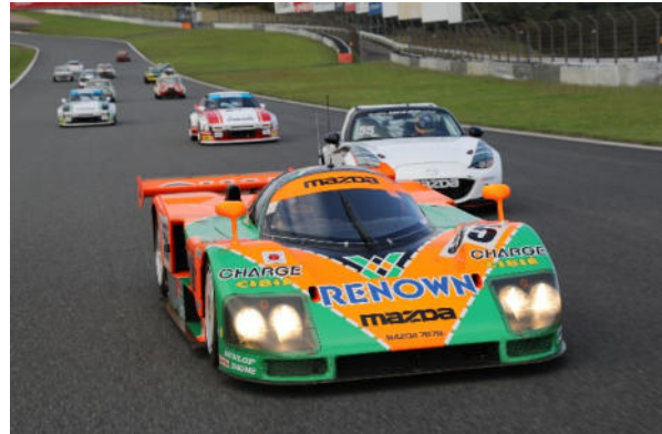
De Mazda 787B rijdt mee in een optocht naast historische Mazda-modellen (2018, Be a Driver. op FUJI SPEEDWAY)