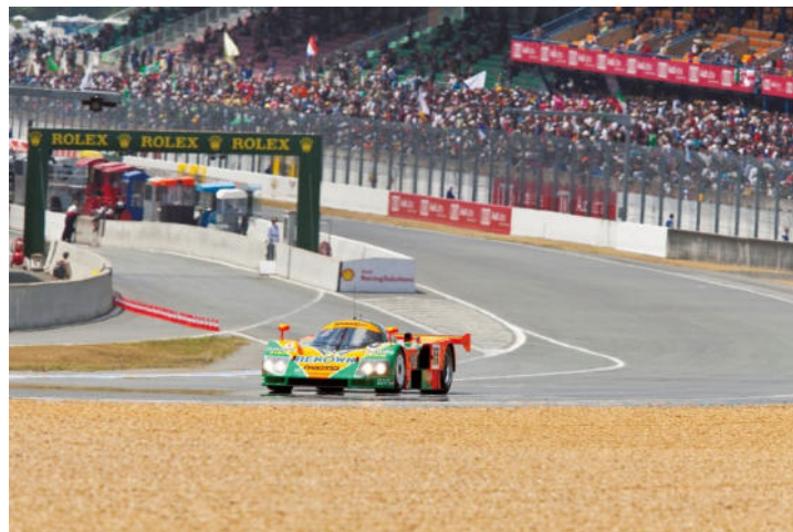
De Mazda 787B tijdens een demonstratieronde ter ere van de 20e verjaardag van zijn overwinning (2011, Circuit de la Sarthe)

Waddinxveen, 25 juni 2026: Mazda Motor Corporation (Mazda) zal demonstratieritten houden met de Mazda 787B – de winnende auto van de 24 uur van Le Mans – tijdens Le Mans Classic 2026, een van 's werelds grootste historische endurance-evenementen, dat van 2 tot en met 5 juli 2026 (lokale tijd) wordt gehouden op het Circuit de la Sarthe in Le Mans, Frankrijk.