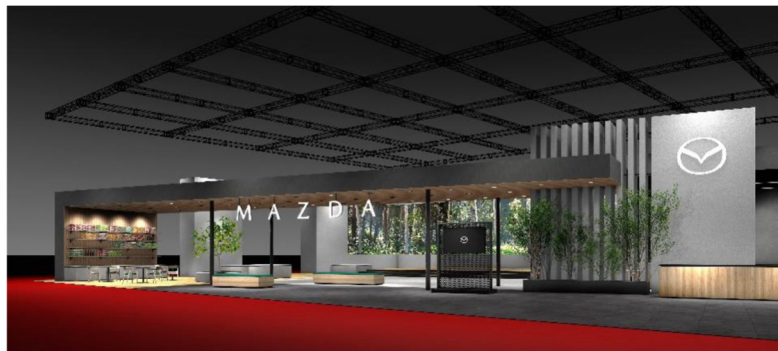
Mazda-stand op de Japan Mobility Show 2025, met de nieuwe versie van het merksymbool

Het vernieuwde ontwerp behoudt de essentie van het oorspronkelijke symbool, dat in juni 1997 werd geïntroduceerd en waarin de letter 'M' wordt gestileerd met de dynamische beelden van vleugels in vlucht. Het symboliseert Mazda's toewijding aan voortdurende innovatie en voorwaartse dynamiek, en markeert een nieuw hoofdstuk in de evolutie van het merk.